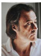
Frédéric Boyer Auteur et présentateur

Diffusion chaque dimanche à 11h50, du 21 juin au 6 septembre, dans Le Jour du Seigneur sur France 2.