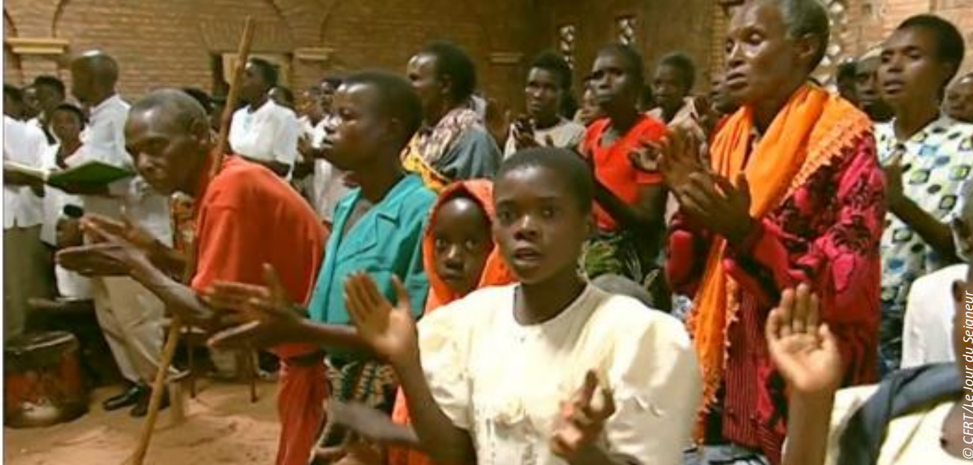
► Extrait du documentaire Rwanda, l'impardonnable ? de Benoît Guillou (2006)