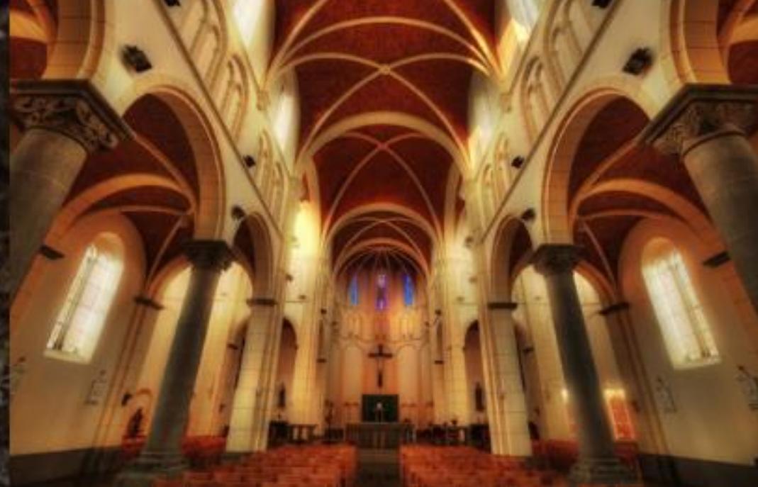
► Église Saints-Syr-et-Julitte (Belgique)