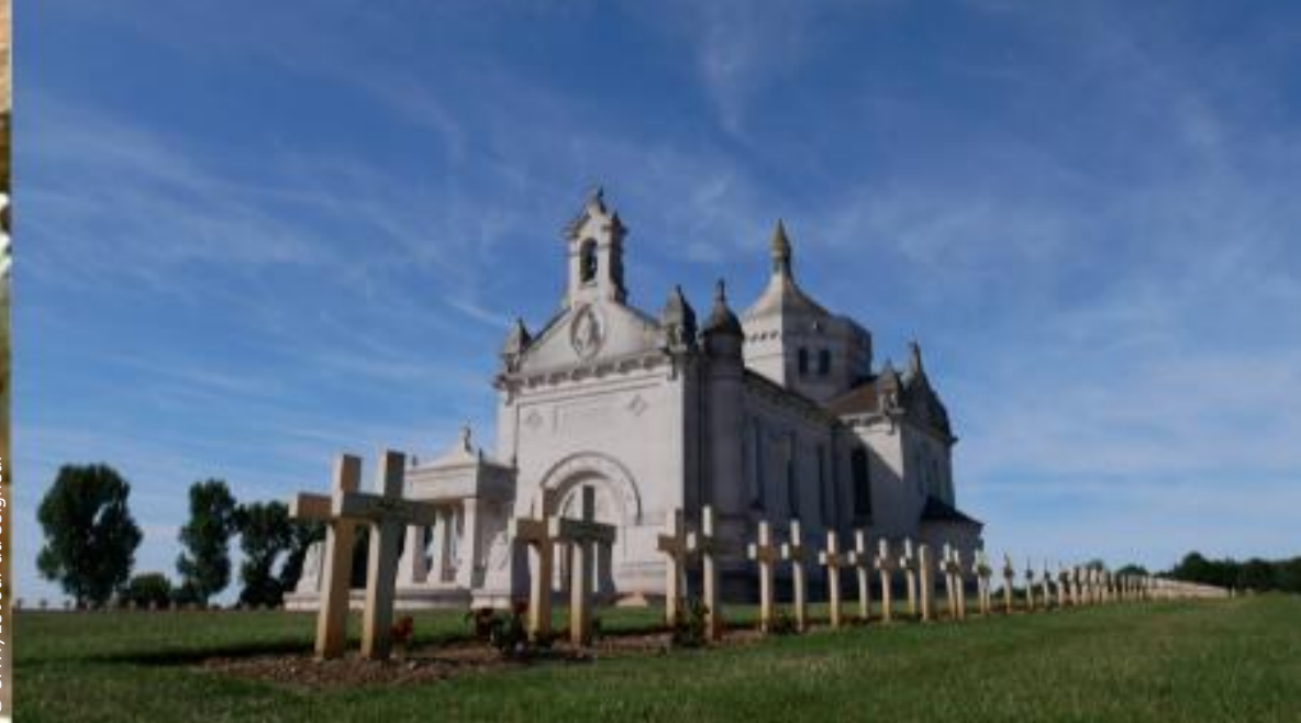
► Basilique Notre-Dame de Lorette (62)