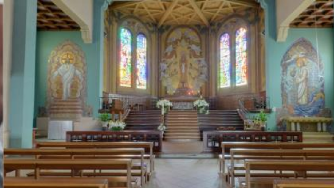
► Église Sainte-Marie à Anglet (64)