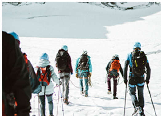
MEMBRES DE L'ASSOCIATION 82-400, EXTRAIT DU FILM