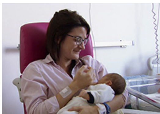
MADELEINE, EXTRAIT DU FILM « PROMESSES DE VIE »