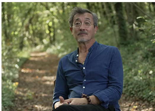
HERVÉ, EXTRAIT DU FILM