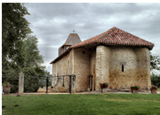
CHAPELLE NOTRE-DAME-DES-CYCLISTES À LABASTIDE-D'ARMAGNAC