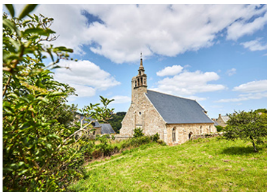
NOTRE-DAME DU YAUDET, PLOULEC'H

Dans la petite unité de soins palliatifs de Marlonges près de La Rochelle, se noue une relation d'une grande humanité entre l'équipe soignante et les patients en fin de vie. La caméra de Grégoire Gosset capte avec délicatesse les petits gestes qui changent la vie des malades et de leurs familles : des moments difficiles, des sentiments d'échec, la profondeur du doute mais aussi le temps de l'amour. Un film qui aide à regarder la mort, pour peut-être mieux voir la vie.