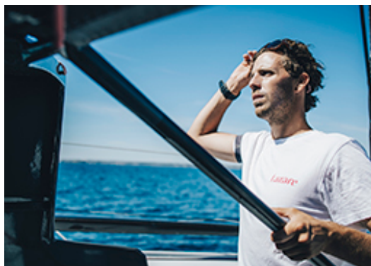
TANGUY LE TURQUAIS