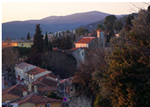
HAMEAU SAINT-FRANÇOIS, EXTRAIT DU FILM