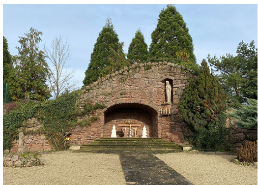
GROTTE NOTRE-DAME DE LOURDES, VAL-DE-MODER (67)

Ce film propose de découvrir la figure de Joséphine Bakhita, esclave soudanaise devenue sainte, patronne des opprimés et des exploités. Née vers 1869 dans un village du Darfour, enlevée par des négriers à l'âge de sept ans, elle a été vendue plusieurs fois à des maîtres cruels, battue et torturée. Elle est par la suite tirée de l'esclavage par un consul italien en poste à Karthoum qui l'achète et l'emmène en Italie. C'est dans ce pays qu'elle rencontre le Dieu d'Amour, son seul maître et Seigneur, reçoit le baptême et entend l'appel du Christ à lui consacrer sa vie. Bakhita la « Moretta », ou « petite Mère Noire » comme on la surnomme, a vécu avec un héroïsme et une simplicité désarmante l'amour du prochain et le pardon des ennemis. Ce récit est celui d'une âme simple, généreuse, courageuse qui, toute sa vie durant, par la grâce de Dieu, a su transformer sa souffrance en bonheur.